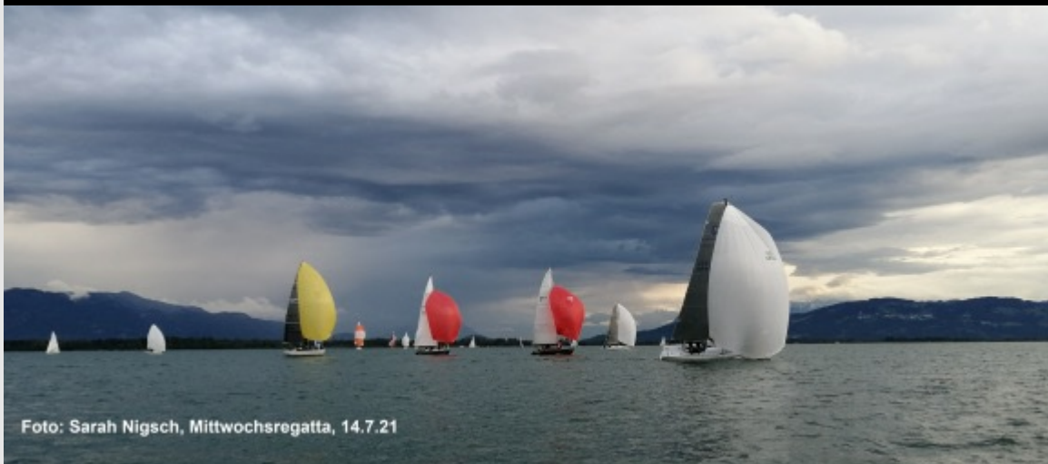
Mittwochsregatta, 14.7.21